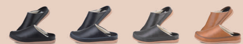
Black M/4573428522608 L/4573428522646 Navy M/4573428522615 L/4573428522653 Gray M/4573428522622 L/4573428522660 Camel M/4573428522639 L/4573428522677