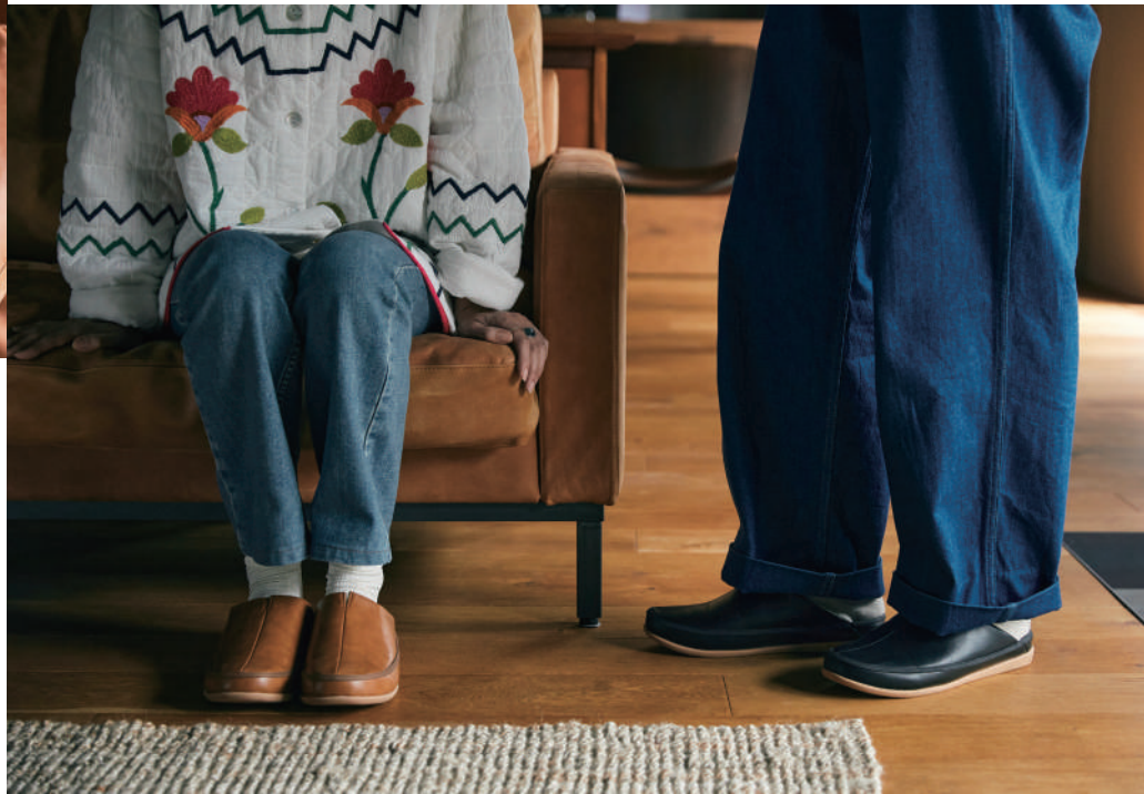
a.loop size : M / L color : Black, Navy Gray, Camel